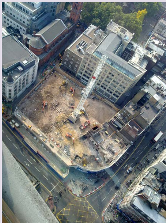
Construcción de infraestructura - Tottenham Court Road Crossrail.

Una proporción cada vez mayor de la población mundial vive en ciudades que van siendo más grandes y complejas. El trabajo de geólogos en la gestión de los múltiples usos simultáneos de la superficie y del subsuelo (a veces entran en competencia) será particularmente importante en las zonas urbanas, si las ciudades del futuro tienen que ser sostenibles.