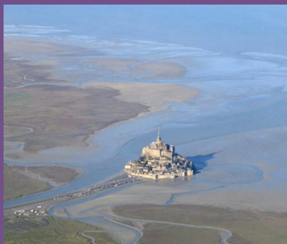
Patrimonio mundial de UNESCO - Monte Saint-Michel y su bahía en Normandía (Francia), catalogados por su herencia cultural junto con su belleza natural.

Los sedimentos son transportados dentro y fuera de las desembocaduras por las mareas y las corrientes, arrastrando contaminantes e interactuando con la química de las aguas marinas. La pesca puede causar daños en el fondo marino, alterando los ecosistemas. La construcción de estructuras de defensas costeras puede cambiar las pautas en la distribución de los sedimentos. El ciclo de nutrientes como soporte ambiental depende de las interacciones geoquímicas entre los diversos agentes que intervienen en el sistema marino y fluvial (sustrato rocoso, sedimentos superficiales, biota, columna de agua y atmósfera).