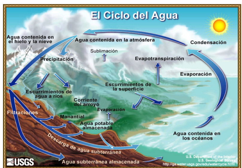
Ciclo del agua.

Debido a las lentas tasas de infiltración del agua subterránea en la recarga y la migración, la contaminación puede acumularse lentamente y tener largos tiempos de residencia. La remediación de la contaminación puede ser costosa, económicamente y en términos del uso de energía. Para minimizar costes y disponer de agua limpia se requiere entender la evolución del agua subterránea y los ciclos geoquímicos de los distintos elementos potencialmente contaminantes.