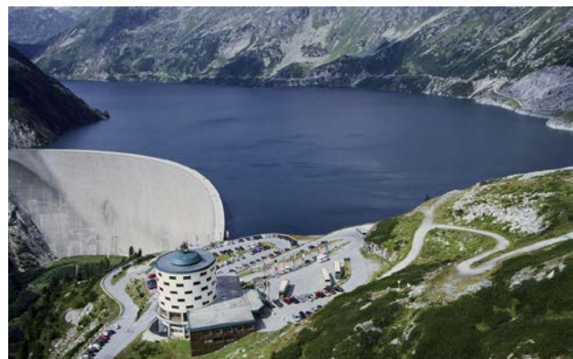
Sistema de tratamiento de aguas residuales y presa de Kölnbrein y sistema de bombeo para almacenamiento de energía, Carinthia (Austria).