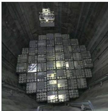
Residuos radiactivos de baja y media actividad en el repositorio de Olkiluoto (Finlandia).

Los combustibles fósiles seguirán suponiendo una parte importante del mix energético de Europa, al menos en las próximas décadas. Algunos países han obtenido enormes beneficios procedentes del petróleo y el gas del Mar del Norte en las épocas más recientes. Los recursos off-shore siguen siendo importantes y el éxito en su explotación dependerá de que se sigan desarrollando nuestro conocimiento geológico y las tecnologías de extracción. También estamos empezando a comprender mejor el alcance de los recursos en el ámbito de los combustibles fósiles no convencionales, como el gas de esquisto, petróleo de esquisto, y metano de carbón, que tienen el potencial de contribuir significativamente a nuestra generación de energía si finalmente se opta por su extracción. Los países que no desarrollen la explotación de sus propios recursos de combustibles fósiles serán más dependientes de la importación de estas materias primas, lo cual afectará a su seguridad energética. Gran parte de la electricidad que se consume en Europa aún se genera a partir de la quema de carbón.