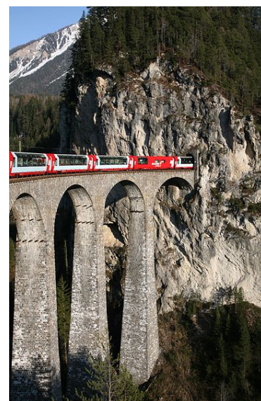
Glacier Express en el viaducto Landwasser (Suiza).

A medida que miramos hacia la geosfera para poder proporcionar una mayor variedad de servicios a los ciudadanos, necesitamos planificar y evaluar con rigor los problemas e interacciones que puedan suceder. Cualquier espacio terrestre, independientemente de su volumen, puede ser utilizado para diferentes funciones, ya sean consecutivamente o al mismo tiempo. En ocasiones puede haber incompatibilidad en el uso de un espacio subterráneo. Los geólogos pueden asesorar a las instancias políticas y económicas sobre asuntos y decisiones acerca de cómo utilizar los espacios del subsuelo.