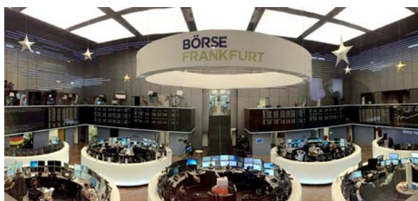
Bolsa de Frankfurt.

La localización y extracción de los recursos geológicos son vitales para el producto interior bruto de la Unión Europea, el crecimiento económico y las rentas públicas. El uso de materias primas para la industria, productos y procesos de consumo, junto con combustibles fósiles para la energía, sostienen nuestra prosperidad y contribuyen de manera fundamental a la economía generando beneficios. La extracción de petróleo, gas, carbón y minerales para la construcción e industrias supone una parte significativa del PIB de las naciones europeas. A modo de ejemplo, el Reino Unido generó cerca de 50.000 millones de euros en 2011, lo que se corresponde con un 12% del producto interior bruto de este país, excluyendo los servicios (con las industrias dependientes de estos recursos la contribución sería superior). Sólo el petróleo y el gas del Mar del Norte suponen una importante contribución a las economías de diversos países europeos, generando miles de millones de euros que se aportan en impuestos cada año. El mercado mundial de las compañías de la industria extractiva, en lo referente al intercambio de materias primas de procedencia europea, fue en 2012 de más de 2,3 billones de euros.