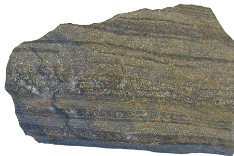
Ejemplo de formación con vetas de hierro en Krivoy Rog (Ucrania).

tecnologías con baja emisión de dióxido de carbono tales como aerogeneradores y vehículos híbridos.