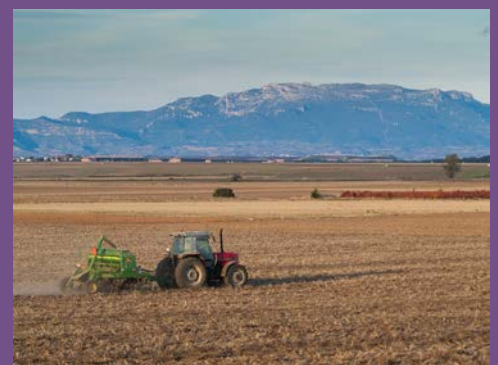
Agricultura en La Rioja (España).

El gran incremento mundial del uso de fertilizantes ha producido una gran demanda de ellos, lo que afecta a la seguridad en el suministro de fosfatos y potasas a futuro. Sólo unos pocos países suministran la mayor parte de las rocas productoras de fosfatos, siendo China el mayor productor. El fosfato explotable es un recurso finito, y consecuentemente los expertos en geología económica están advirtiendo que su uso debe reducirse drásticamente en los años venideros si pretendemos evitar efectos devastadores en la producción de alimentos. El empleo continuado de los fosfatos (en contraste con las potasas) puede tener además efectos dañinos en el medioambiente, debido a que los fosfatos se depositan en los ríos causando su eutrofización.