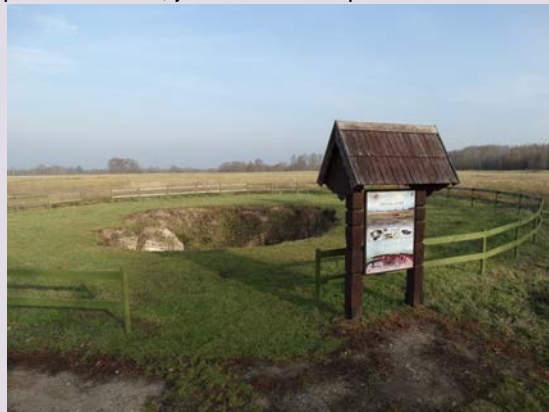
Dolina Kárstica en el distrito Biržai (Lituania).

Al igual que los volcanes, los tsunamis pueden tener serios efectos en puntos alejados donde impactan. El registro geológico muestra que grandes áreas de las costas europeas han sufrido tsunamis relevantes en el pasado reciente, y este fenómeno puede volver a ocurrir.