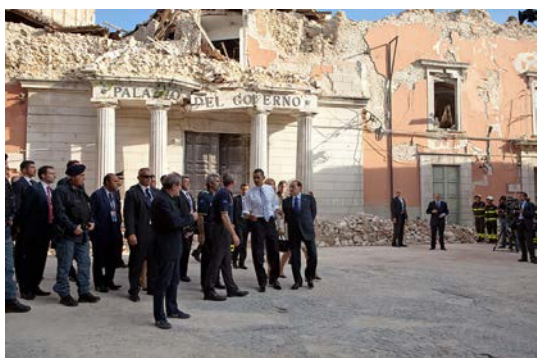
Presidente Barack Obama visitando la zona dañada de L'Aquila (Italia) tras el terremoto de 2009.

La predicción probabilística de los terremotos, tomando una zona y un determinado periodo de tiempo, ha mejorado enormemente en las últimas décadas como resultado de la investigación geológica. No obstante, actualmente no es posible hacer predicciones deterministas sobre cuándo y dónde exactamente puede ocurrir un terremoto, y la mayoría de los geólogos no consideran que eso llegue a ser una posibilidad realista. La cartografía del riesgo sísmico y la modelización de sus efectos son esenciales en la mejora de la preparación y aumentan la resiliencia. El proyecto SHARE (Seismic Hazard Harmonization in Europe) ha establecido estándares de datos comunes y metodologías de análisis, y supondrá el desarrollo de bases comunes para mitigar los efectos de los terremotos.