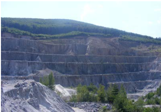
Mina Perlite (Pálháza – nordeste de Hungría).

Una serie de operaciones mineras metalíferas se están poniendo en