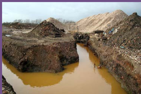
Vertido químico en Wakefield (Reino Unido).

Para el suministro seguro y sostenible de alimentos se necesitan suelos y agua de alta calidad. El suelo actúa además como un importante sumidero del carbono atmosférico, registrando los cambios pasados y presentes, constituyendo una herramienta vital para la comprensión y la búsqueda de las variaciones medioambientales. La protección y mejora de nuestras aguas (ríos, océanos y aguas subterráneas) dependen del conocimiento sobre el comportamiento y la interacción existente entre el agua, los suelos y la atmósfera en superficie, y de éstos con la geología del subsuelo.